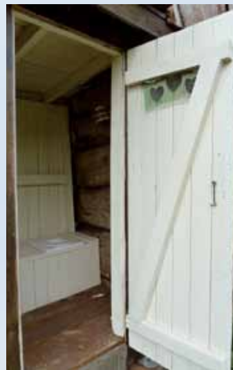
Es war einmal ...