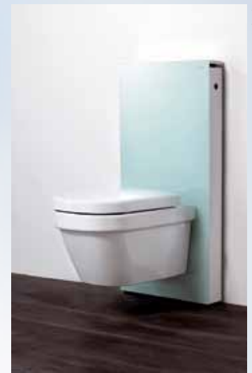
und so ist es heute.